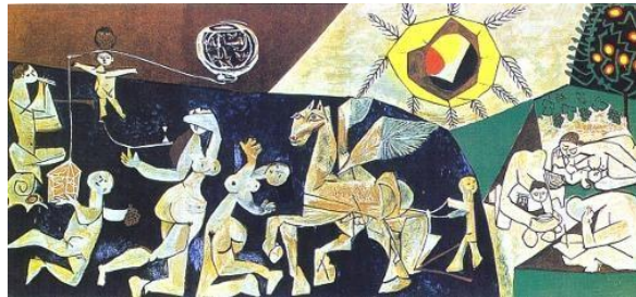
P. Picasso - La pace - Vallauris