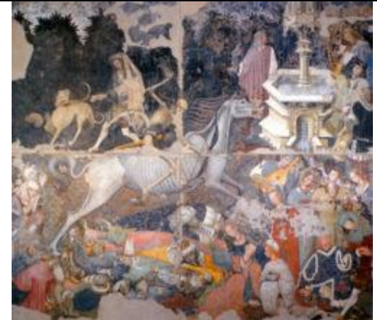
Trionfo della Morte - Maestro del Trionfo della Morte, 600x642 cm., inizio XV secolo