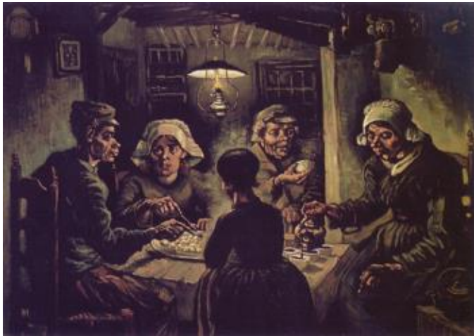
I mangiatori di patate - Vincent Van Gogh, 1885 - olio su tela, 82 x 114 cm - Amsterdam, Museo Van Gogh