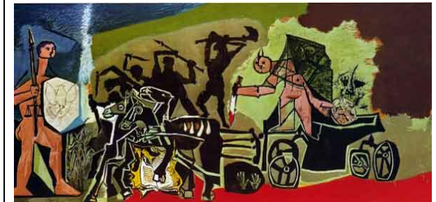
Picasso - La guerra - Vallauris