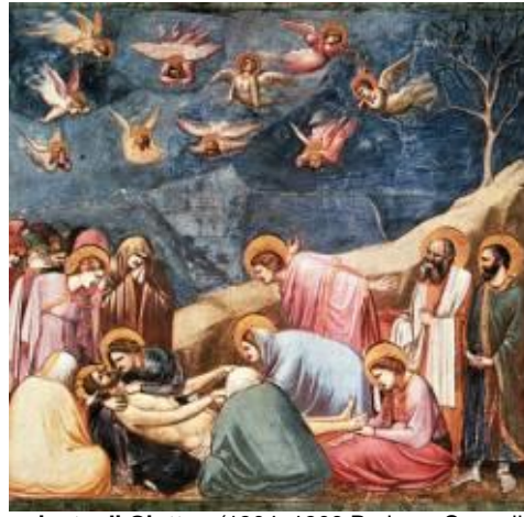
Il Compianto di Giotto - (1304-1306, Padova, Cappella degli Scrovegni)